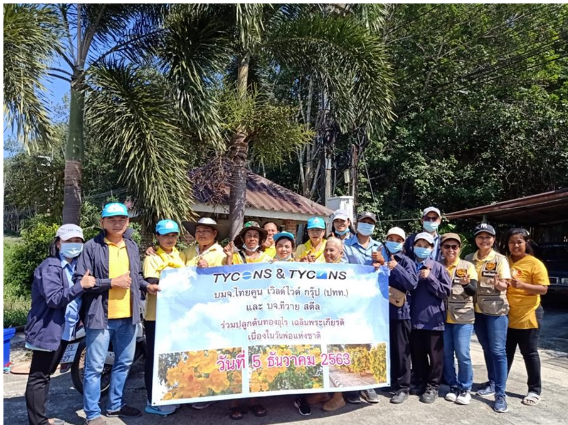
ร่วมกิจกรรมทำบุญวันพ้อแห่งชาติและปลูกต้นทองอุไรเฉลิมพระเกียรติ