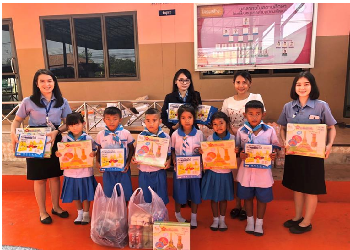
มอบอุปกรณ์การเรียน ของขวัญ และขนมเพื่อสนับสนุนการจัดกิจกรรมวันเด็กแห่งชาติ