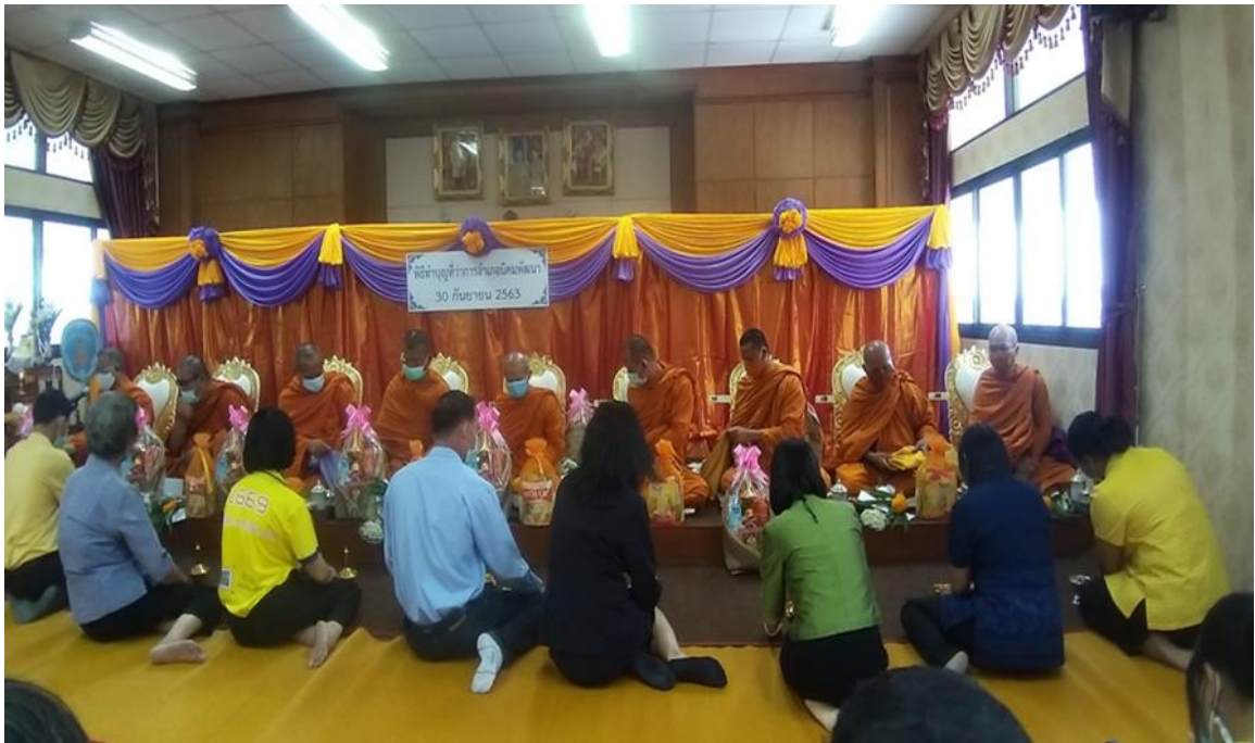
ทำบุญเลี้ยงพระ