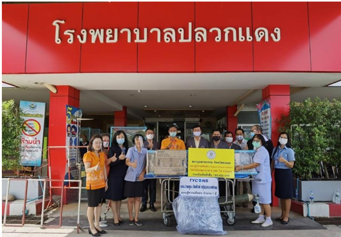
มอบเงินร่วมจัดทำตู้ความดันโลหิต